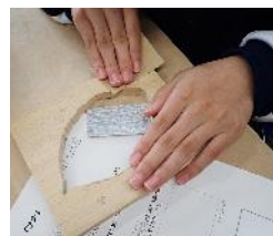
撮影した写真を飾るブナ材のフォトフレームも作成

今年度は夏、秋、冬と歌オブナ林に通い、季節の移り変わりを撮影しました。特に秋は黄葉のピークと重なり、「ずっと忘れられない景色だね」という声も聞かれました。