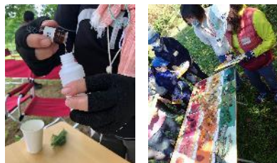
森の香りをブレンド 秋のカラーチャートづくり

感染症流行の影響もあり、今年の森林ウォーキングは7月と10月の2回だけ開催。参加者は森林の色や香りで癒されるプログラムを行いました。