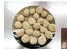
▲どんぐりの配合を変えてどんぐりだんごの味くらべ

今年度は1・2年生を対象に、それぞれ個人テーマを「鳥」「きのこ」「木」「人と自然のかかわり」と設け、調査方法から自分で考えて、歌オブナ林と添別ブナ林で実地調査を行いました。