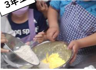
▲どんぐりクッキーづくり