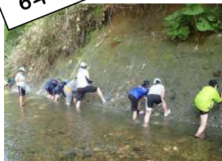
▲添別川で貝化石採取