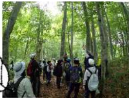
▲自作のフォトフレームに飾る写真は歌オブナ林で撮影しました。

また、毎年ブナ材を用いたフォトフレームを作成しており、今年度作成したものは道の駅に展示されました。