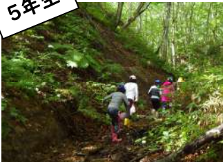
▲添別ブナ林で源流探し中